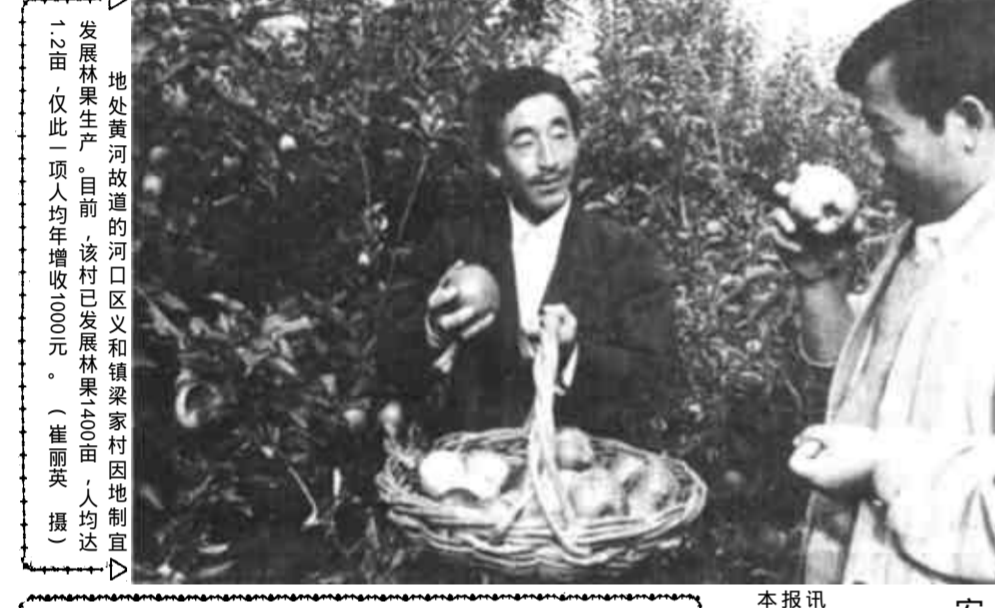
地处黄河故道的河口区义和镇梁家村因地制宜发展林果生产，目前，该村已发展林果200亩，人均达1.2亩，仅此一项人均增收1000元。